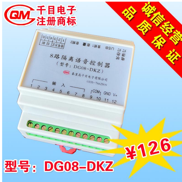
图 1 播放器整体图