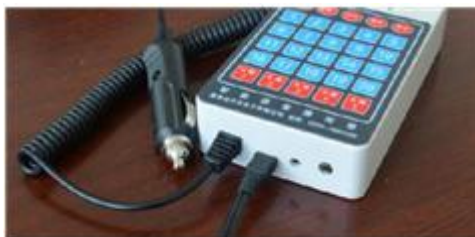
图 5. USB 接口连接 PC 机