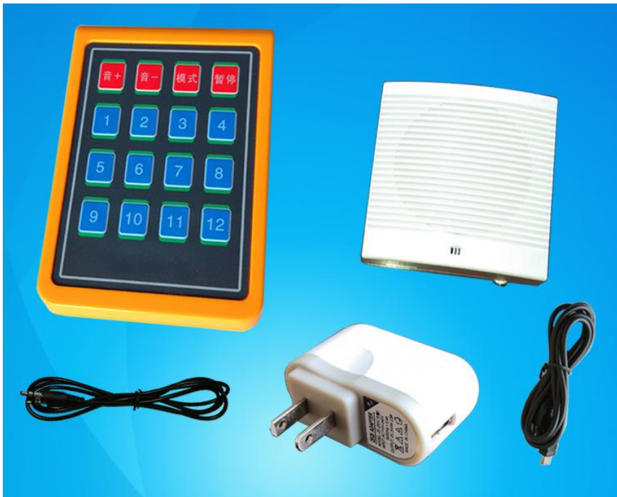
图 1. 播放器整体图